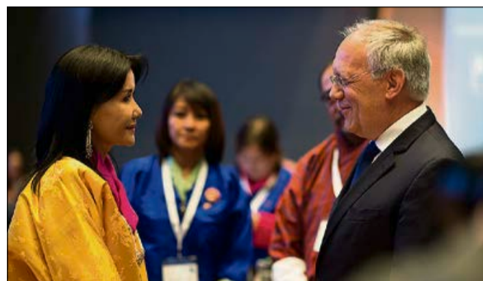
BR Johann Schneider-Ammann begrüsst Her Majesty the Queen Mother of Bhutan, Sangay Choden Wangchuck .