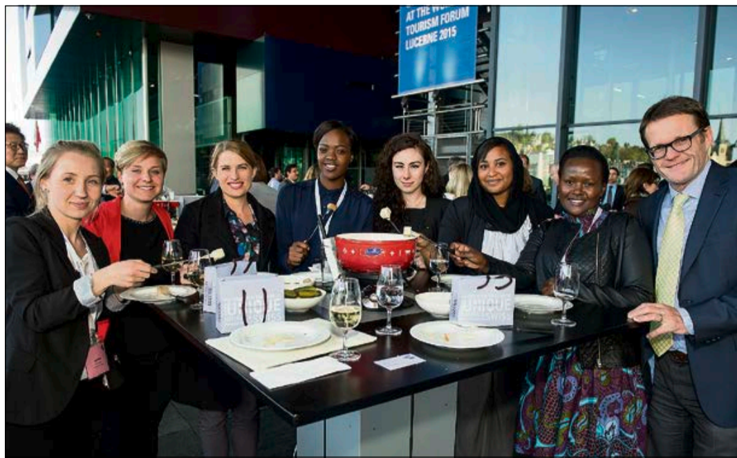
Teilnehmende des «World Tourism Forum» Luzern beim Fondueplausch vor dem KKL.